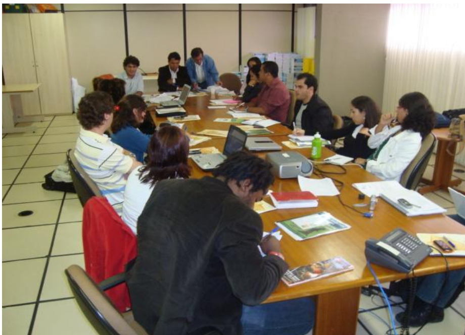
GT reunido em Brasília – 18/05/2009