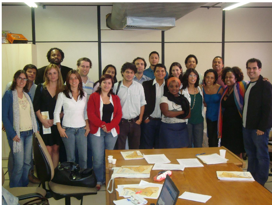
GT Nacional Brasil